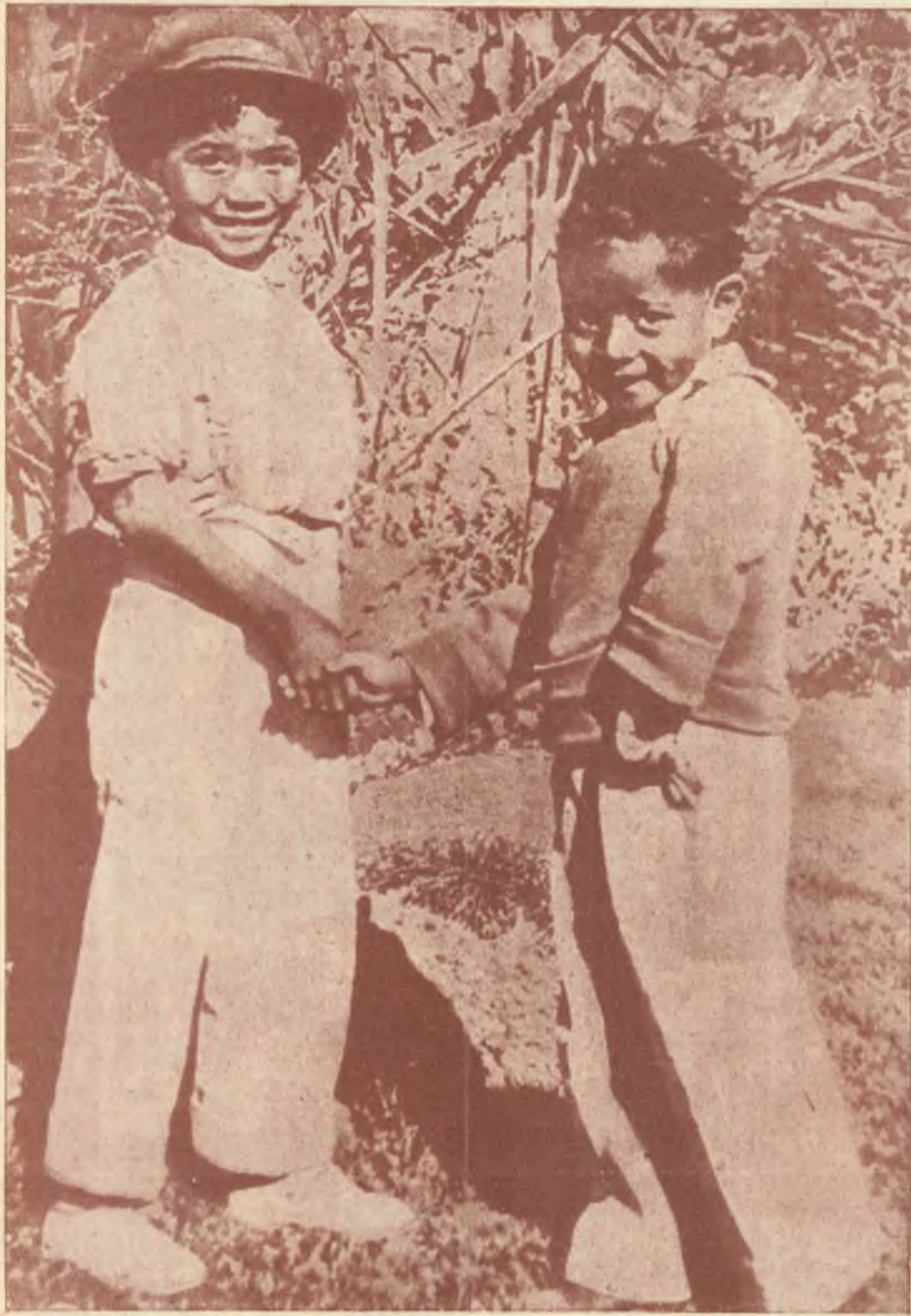
Missione Salesiana del CONGO BELGA: Fraternità di razza.