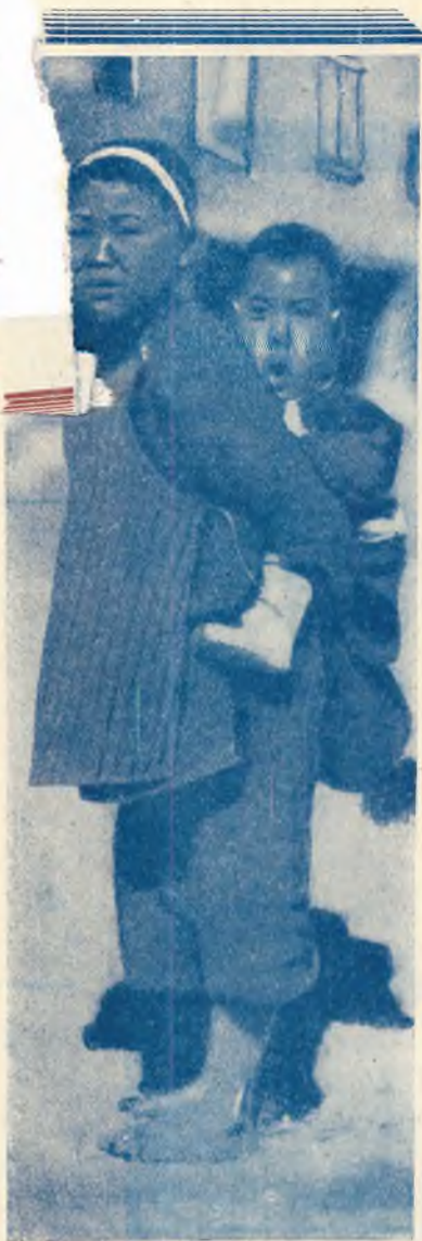
Bambina cinese col suo fratellino.