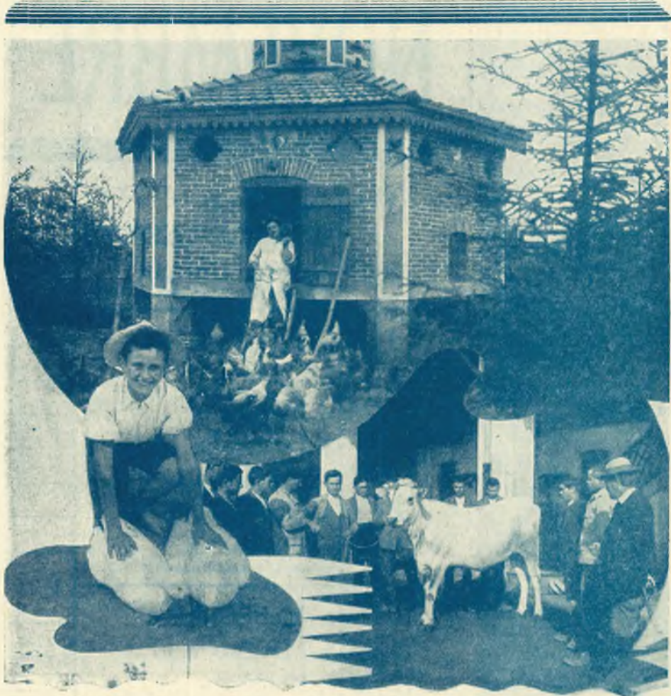
SCUOLE AGRICOLE SALESIANE - L'Addestramento dei ragazzi ai vari lavori agricoli.

La Scuola Agraria Missionaria - Bivio di Cumiana (Torino) - accetta giovinetti aspiranti missionari agricoltori che abbiano compiuto la 4 a classe elementare.