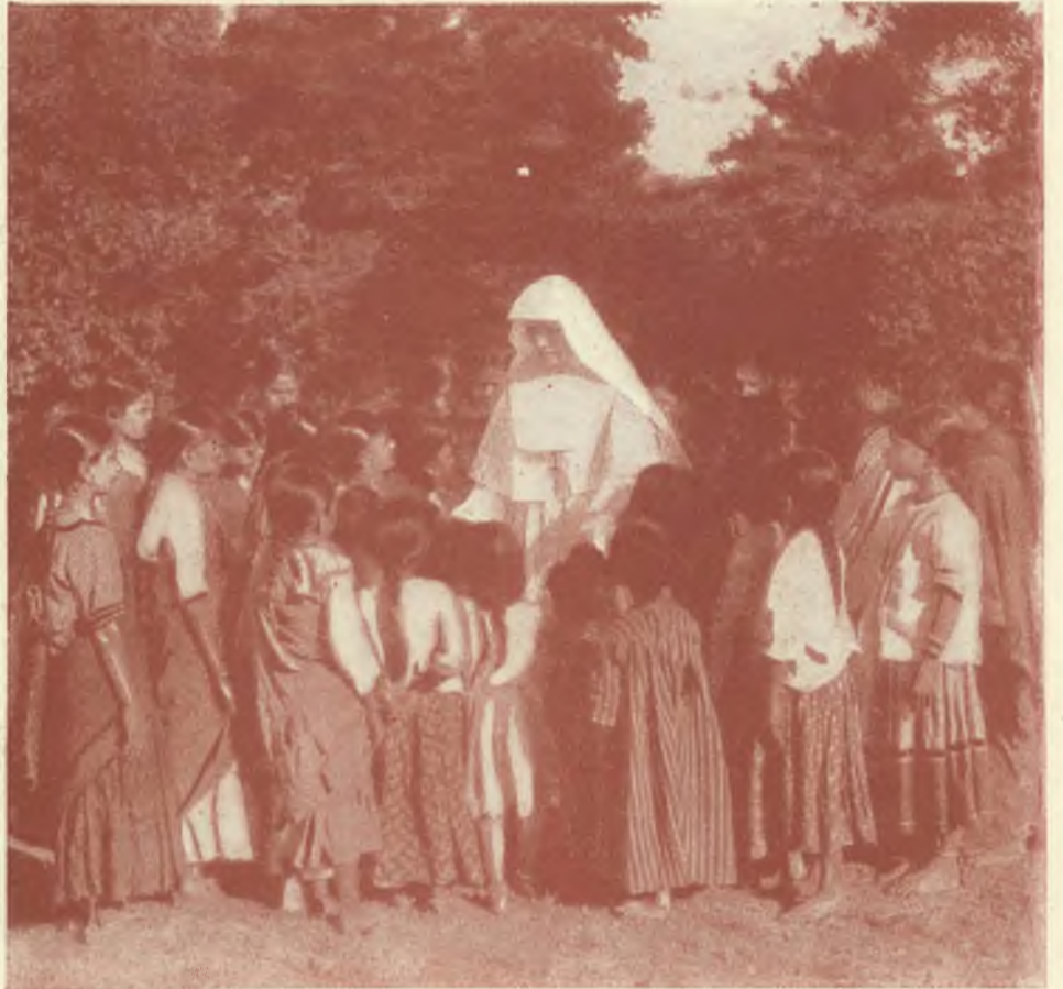
TANJORE (INDIA) - Oratorio delle Figlie di Maria Ausiliatrice. - Giocondità in un sereno riflesso di amore cristiano.