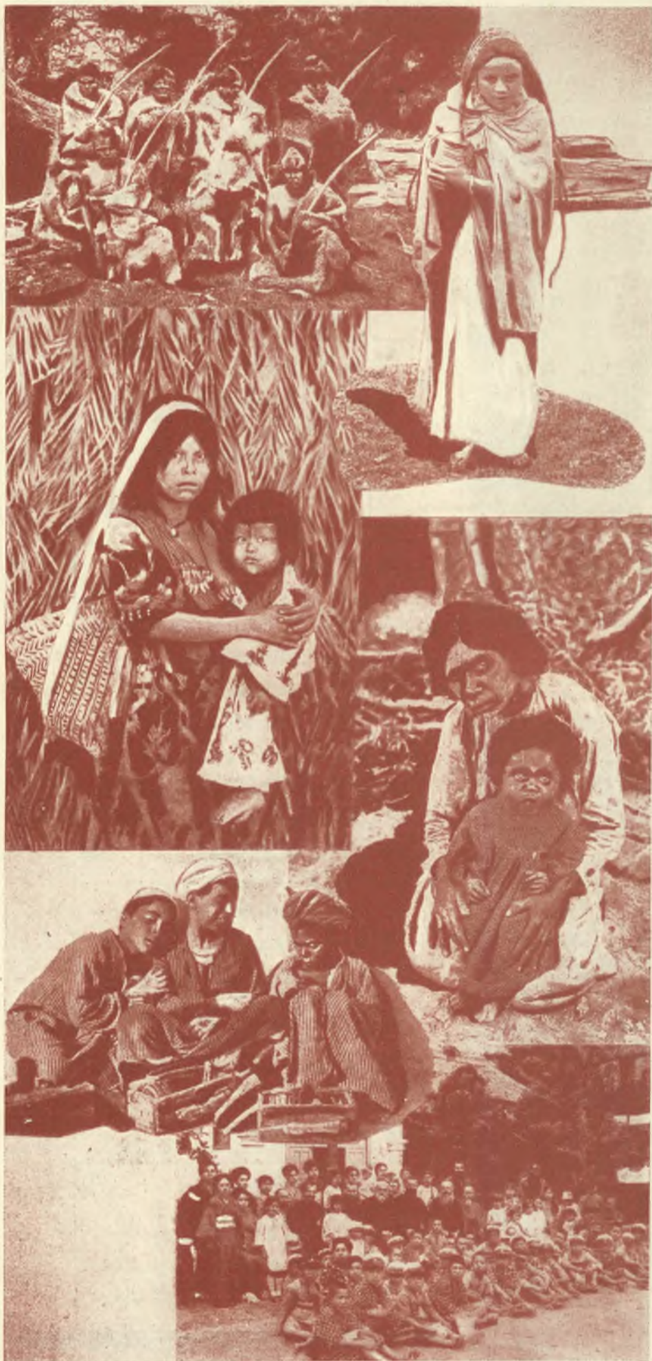
Da varie Missioni Salesiane - In alto : Indi Onas della TERRA DEL FUOCO. Una portatrice dell'INDIA - CHACO-PARAGUAY: Una mamma col bambino. Mamma Australiana - Ragazzi Palestinesi - Una cristianità del GIAPPONE.