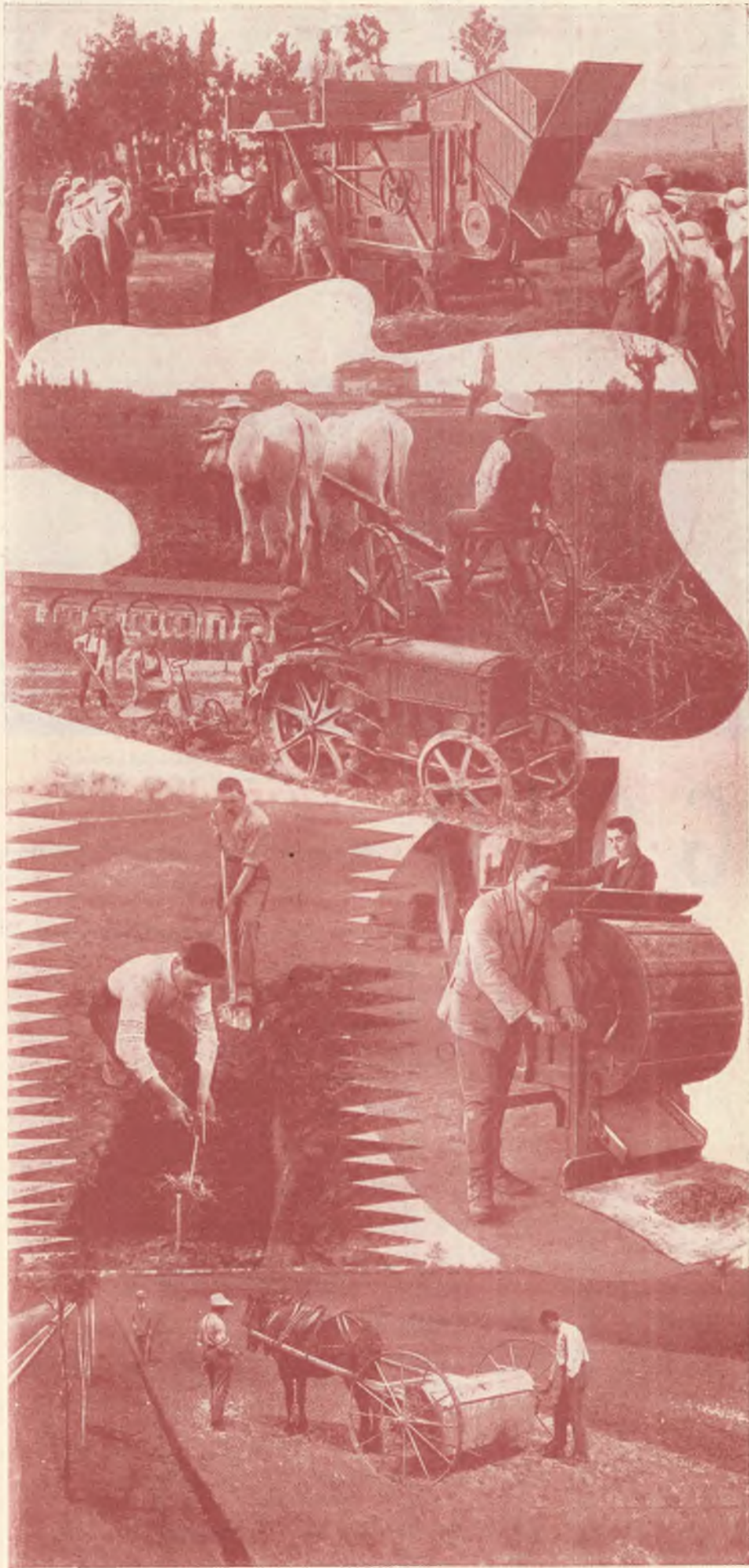
SCUOLE AGRICOLE SALESIANE - L'addestramento dei ragazzi ai vari lavori agricoli. La Scuola Agraria Missionaria - Bivio di Cumiana (Torino) - accetta giovinetti aspiranti missionari agricoltori che abbiano compiuto la 4ª classe elementare. Per informazioni e domande di accettazione, rivolgersi alla Direzione.