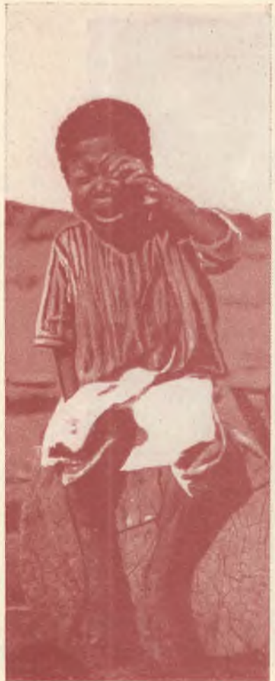
BRASILE-MATTOGROSSO - Bambino della Missione di Sangradouro. Tutto il mondo è paese!