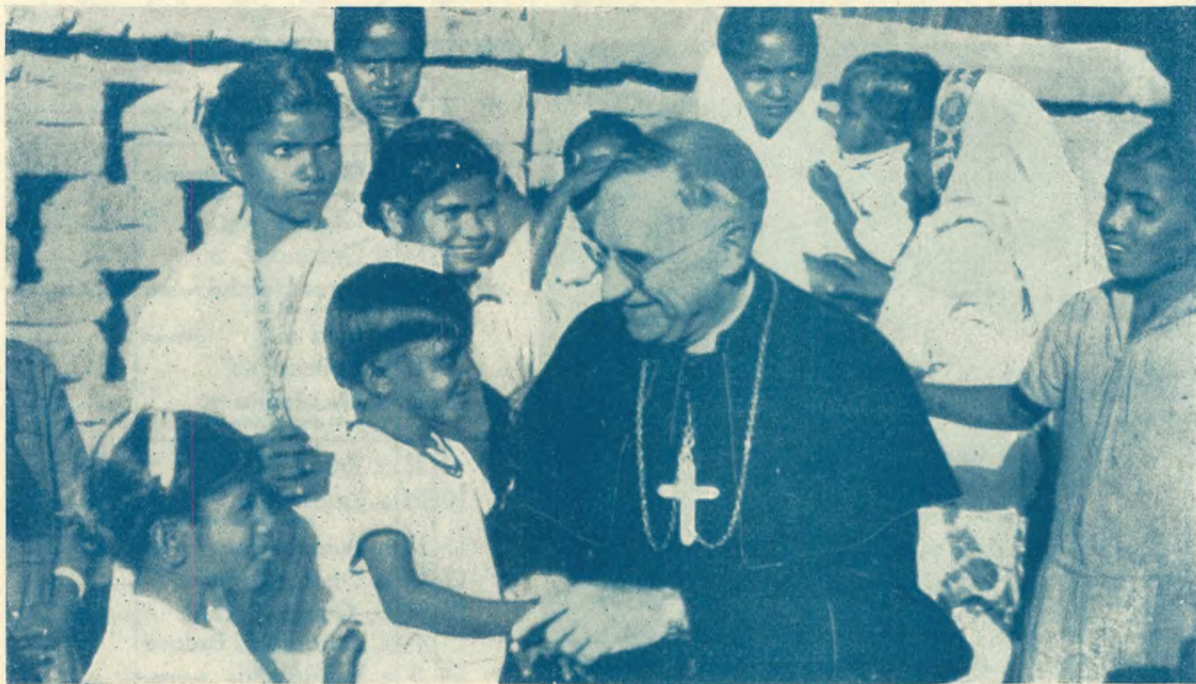
KRISHNAGAR (BENGAL-INDIA) - Fervore e attività in un fiorire di novella vita.