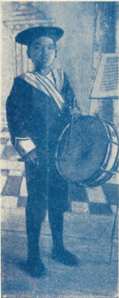
Un piccolo musicista cinese.