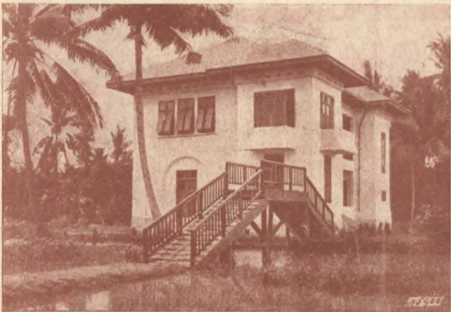
SIAM - WATPHLENG: Scuola Salesiana.