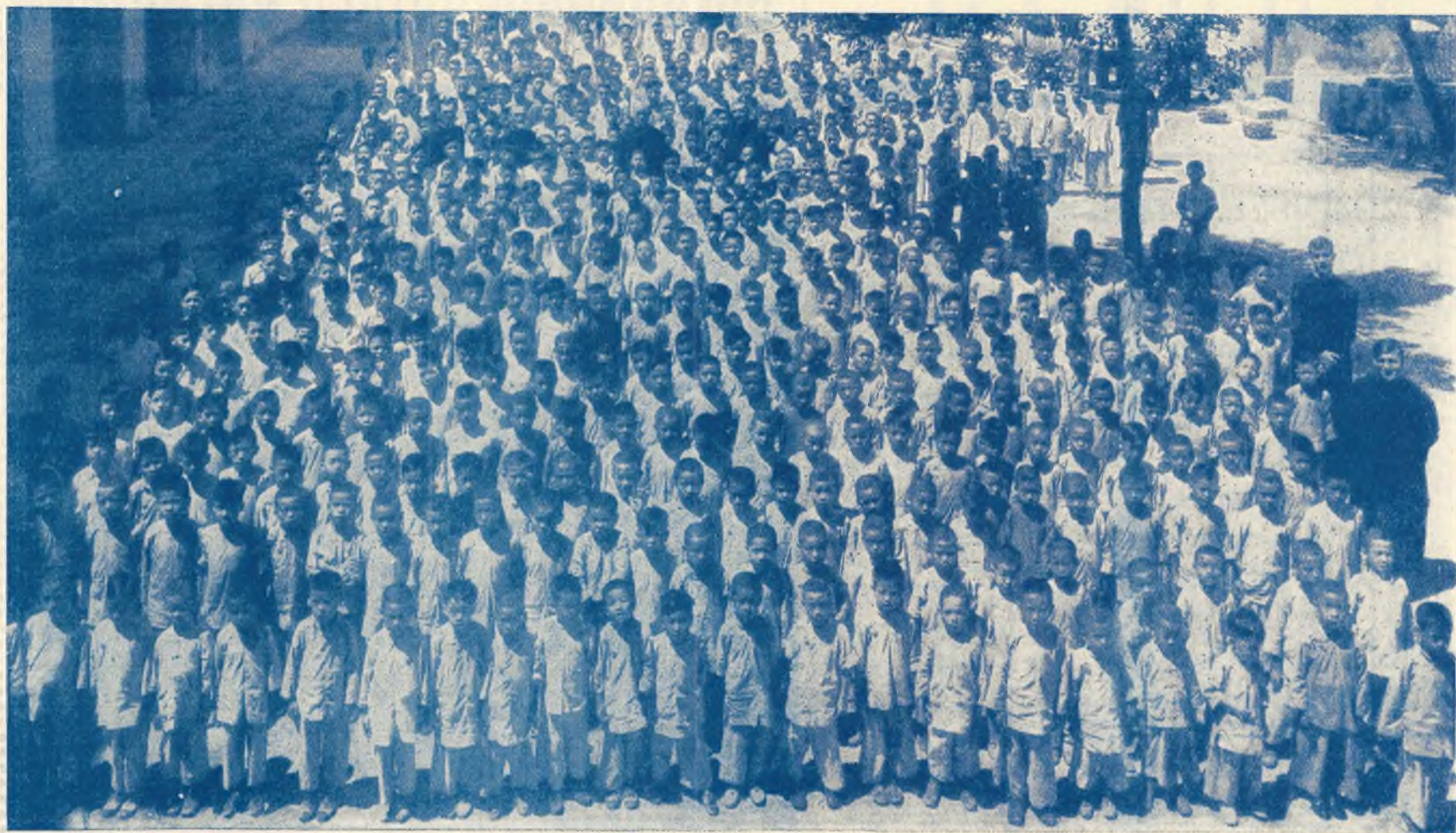
HONG KONG (Cina) - Alunni dell'Istituto Salesiano "San Luigi".