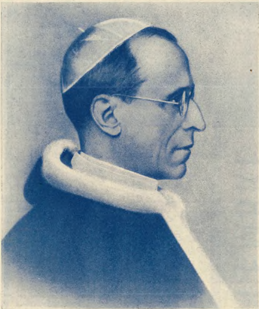
S. S. PIO XII

PERIODICO QUINDICINALE DELLE OPERE E MISSIONI DI S. GIO. BOSCO PER I COOPERATORI E LE COOPERATRICI SALESIANE Direzione Generale - Torino (109) - Via Cottolengo, 32 - Telefono 22-117