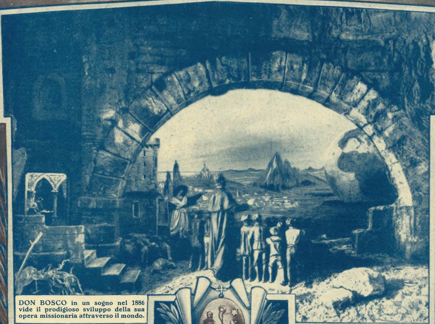
DON BOSCO in un sogno nel 1886 vide il prodigioso sviluppo della sua opera missionaria attraverso il mondo.