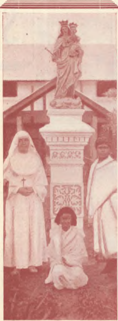
ASSAM - INDIA - Piccolo monumento a Maria SS. Ausiliatrice.